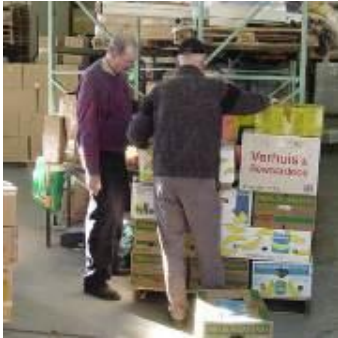
Opslag van kleine dozen tot grote voertuigen.

Aan N.G.O.'s en zendings- en missionaire organisaties worden bij de Baanderij faciliteiten geboden voor opslag, inpakken, transporten papierwerk rondom hulpactiviteiten.